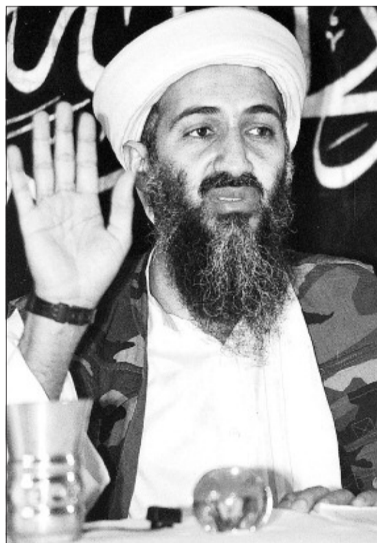
Bin Laden, en Afganistán, en mayo de 1998.